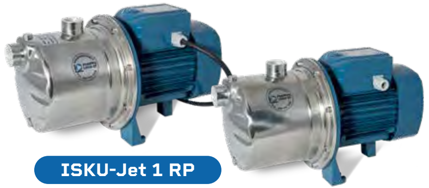
ISKU-Jet 1 RP

3 RP on kolmivaihevirralla toimiva, tehokas, ruostumaton kylmävesipumppu. Sen pääasiallinen käyttökohte on kolmivaihevirralla toimivien painevesilaitosten pumppuna. Pumpun maksimipaine on noin 5,5 bar. Vesituotto riittää isompaan käyttöön.